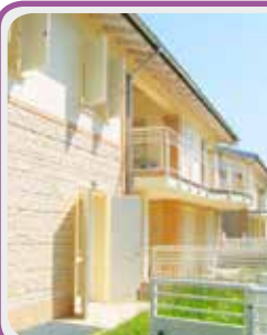
C-098 Castenuovo R.

In CENTRO app. all'ultimo piano di una palazzina di 6 unità composto da sogg. con CUCINA A VISTA , dis. notte, 2 CAMERE , bagno, balcone, ampia cantina con LAVANDERIA e garage. RISTRUTTURATO . € 97.000