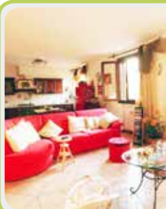
R-642 vic. Magreta

In CONTESTO del 1995 proponiamo APP.TO su 2 LIVELLI comp. da: soggiorno cottura con balcone, MATRIM. e bagno, al p. sup.: OPEN SPACE , MATRIMONIALE e bagno. GARAGE al p.interrato. VICINO al PARCO. € 140.000