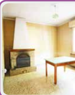
C-124 Castelnuovo R.

Disponiamo di VILLETTA di testa composta da: AMPIO SOGGIORNO con camino , CUCINA ABITABILE , dis. notte, 3 CAMERE , 3 bagni , TAVERNA , GARAGE DOPPIO e GIARDINO SU 3 LATI . € 345.000