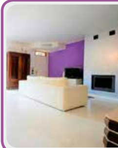
C-069 Castelnuovo R. frazione

Disponiamo di VILLETTA di testa composta da: AMPIO SOGGIORNO con camino , CUCINA ABITABILE , dis. notte, 3 CAMERE , 3 bagni , TAVERNA , GARAGE DOPPIO e GIARDINO SU 3 LATI . € 345.000