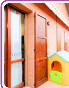
C-118 Castelnuovo R.

App.to ULTIMO PIANO in palazzina di RECENTE COSTRUZIONE con ingresso su soggiorno con TERRAZZO , cucina, dis. notte, 2 camere, bagno e lavanderia; al piano sottotetto soffitta (camera), lavanderia (bagno) e garage € 185.000