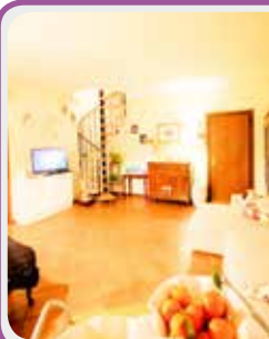
C-132 Castenuovo R.

App.to ULTIMO PIANO in palazzina di RECENTE COSTRUZIONE con ingresso su soggiorno con TERRAZZO , cucina, dis. notte, 2 camere, bagno e lavanderia; al piano sottotetto soffitta (camera), lavanderia (bagno) e garage € 185.000