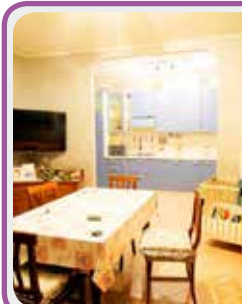
C-135 Castenuovo R.

Proponiamo APP. TO al 1° ed ULTIMO PIANO composto da soggiorno con cucina e balcone, 2 CAMERE e un bagno, GARAGE con LAVANDERIA e 2 cantine.