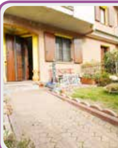
C-136 Castenuovo lim.

Proponiamo APP.TO INDIPENDENTE CON GIARDINO composto da soggiorno con A/K, dis. notte, 2 CAMERE e bagno, collegamento interno a LAVANDERIA e GARAGE DOPPIO .