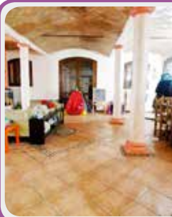
C-134 Castelnuovo R.

Porzione di casa INDIPENDENTE con GIARDINO composta da AMPIO GIARDINO , cucina, 3 CAMERE e 3 BAGNI , MANSARDA open space, lavanderia e taverna/garage.