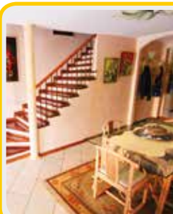
S-699 Sassuolo lim.

In OTTIMO contesto PORZIONE DI CASA indip. con GIARDINO PRIVATO comp. da: ampia zona giorno con cucina separata e bagno; al 2° P. 3 MATRIMONIALI e bagno. DOPPIO GARAGE. OTTIME FINITURE.