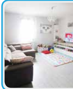
M-310 Maranello fraz

In contesto seminuovo 2 LIVELLI con 3 CAMERE e 2 BAGNI , cucina separata, ingr. su AMPIO sogg. e balcone. Zona notte MANSARDATA (soffitta) ad uso camera. GARAGE DOPPIO . ZONA NUOVA STRADA CHIUSA!