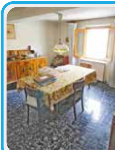
M-410 Maranello fraz.

PORZIONE DI CASA da ristruttur. a 1 km ca dal castello di Maranello, su 2 livelli, 3 CAMERE , sogg., cucina ab., bagno, servizi a P. semint. 2 cantine e TAVERNETTA . Sottotetto in parte sfruttabile. Costruzione ante '67 complet. originale.