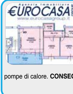
M-408-A5 Maranello fraz.

In NUOVO CONTESTO CL. A con TERRAZZO , cappotto termico, risc a pav., 2 MATRIMONIALI (14 mq e 16 mq), zona giorno di 28mq e 2 BAGNI ; GARAGE da agg. da 17 a 40mq, rampa riscaldata, p.solari e pompe di calore. CONSEGNA FINE PRIMAVERA 2022.