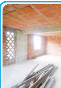
M-412 Maranello vicinanze

PORZIONE di CASA di buone metrature allo stato GREZZO con consegna immediata per completare i lavori, GIARDINO di proprietà, SALA e CUCINA di 50 mq, BAGNO ; al 1°P 2 CAMERE , cabina armadio e bagno; 2 vani nel sottotetto con lavanderia.