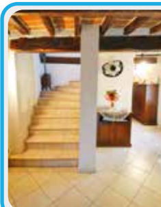
M-404 San Dalmazio

Porz. di casa parz. RISTRUTT. (a 4km da San Dalmazio) con area verde a pochi metri dall'abitazione; sogg. e cucina separabile di 28 mq con CAMINO e stufa a pellet, bagno, al 1° e 2° piano ulteriore soggiorno, 3 CAMERE e bagno.