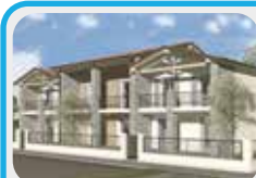
M-407 Maranello fraz.

NUOVA COSTRUZIONE di 3 VILLETTE a schiera con doppio garage, TAVERNA con lavanderia, AMPIA ZONA GIORNO di oltre 40 mq al PT con