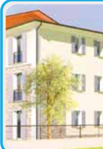
M-408-A1 Maranello fraz.

App.to INDIPENDENTE con 150 mq di GIARDINO , portico di 17 mq , ingr. su AMPIA SALA con ang. cottura di 28 mq, dis.notte, 2 MATRIMONIALI ( 16 mq e 14 mq ), 2 bagni . Da aggiungere garage. Consegna inizio 2022, pan. solari, risc. a pav., cappotto e ottime finiture!