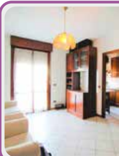
C-359 Castelnuovo lim.

Vendiamo APP.TO al 2° piano con ingresso su soggiorno con TERRAZZINO , cucina, dis. notte, camera e bagno al piano superiore troviamo una camera/soffitta ed un ripostiglio. GARAGE con cantina al piano terra.