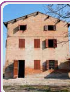
C-384 Castelnuovo lim.

Vendiamo in zona verde e tranquilla CASA INDIPENDENTE da ristrutturare, con AMPIO GIARDINO PRIVATO.