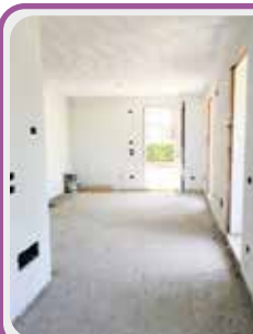
C-030B Castelnuovo R.

Vicino al CENTRO disponiamo di un appartamento al 1°PIANO composto da ingresso su sala con angolo cottura con TERRAZZO , dis.notte, 2 CAMERE , bagno e GARAGE DOPPIO!