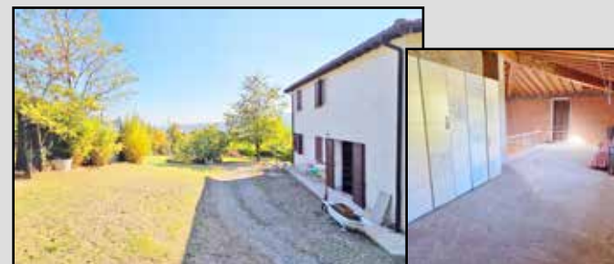
M-593 Maranello prime colline SENZA IMPIANTI

Ampliamento realizzato nei primi anni 2000, allo stato grezzo (senza impiantistica, pavimenti ed infissi), PORZIONE di CASA INDIPENDENTE TERRA-CIELO con AMPIO GIARDINO su 3 lati, possibilità di realizzare soggiorno e cucina separata con bagno a piano terra, scala interna per la zona notte, ora pensata per 2 CAMERE MATRIMONIALI e ult. bagno. NO GARAGE. OLTRE 1.000mq di giardino.