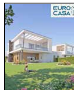
M-589 Maranello Fraz.

Lotto di TERRENO EDIF. di circa 1.000mq , un'opportunità unica per realizzare la casa dei tuoi sogni, con AMPI SPAZI ESTERNI PRIVATI . In zona tranquilla e riservata ma comoda alle principali vie di comunicazione e a tutti i servizi.