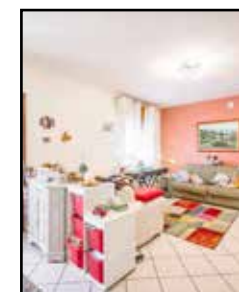
M-572 Maranello frazione

Porzione di BIFAMILIARE con DUE APPARTAMENTI INDIPENDENTI tra loro: P. TERRA: 2 matrimoniali, sala, cucina, bagni e lavanderia; 1° PIANO: 4 CAMERE , 2 BAGNI e ampia zona giorno. GIARDINO e GARAGE.