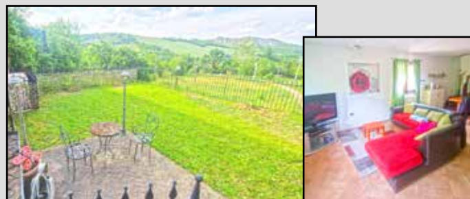
M-596 Maranello fraz. ESCLUSIVA

A partire da 257.000 € Garage e posto auto esclusi