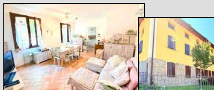
M-587 Maranello in aperta campagna

PORZIONE di casa TERRA-CIELO con GIARDINO PRIVATO , soggiorno con cucina separata, 3 CAMERE da letto e 2 bagni; COSTRUZIONE DEL 2009 , GARAGE e posto auto esterno. ZONA VERDE e TRANQUILLA adatta a chi ama essere immersi nel verde ma a soli 3 km dalle principali vie di comunicazione. RISCALDAMENTO A PAVIMENTO.