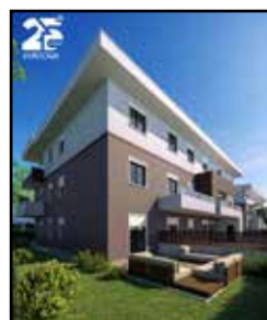
M-576-A03 Solignano Nuovo

In nuova costruz. in CLASSE EN. A4 consegna INIZIO 2027 app.to al PIANO TERRA con GIARDINO PRIVATO , sogg. angolo cottura, dis.nocte, 2 CAMERE GRANDI e 2 BAGNI . Progetti e varie tipologie in uff. Prezzo garage da agg. a parte.